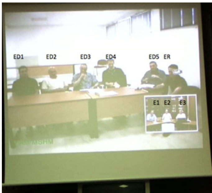
Fig. 3A: Les étudiants détenus (EDX) et leur enseignant responsable (ER)

La réunion étudiée ici présente les enseignants dans la salle d'une institution universitaire dédiée à la vidéocommunication (à droite sur la photo), et les étudiants-détenus dans la salle de la maison centrale (à gauche sur la photo).