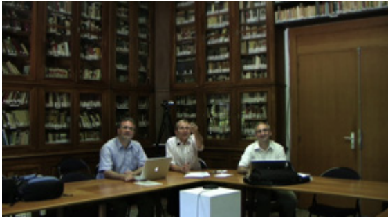
Fig. 3B: Les enseignants universitaires (EX)

Les observations ethnographiques de ces éléments situationnels permettent de mettre en évidence les conséquences interactionnelles de ces modifications. Le nombre d'interlocuteurs (neuf, sur les deux sites) fait de cet échange une interaction multi-participative. Les interventions sont longues et peu fréquentes pour chaque participant. Les bornes temporelles de la réunion contraignent en fait la phase finale de l'interaction parce que l'administration pénitentiaire a imposé un cadrage temporel strict de la réunion d'une durée n'excédant pas deux heures. De manière systématique, dans tout échange avec les prisonniers, ainsi que dans ces contributions interactionnelles soumises à analyse, une orientation clairement revendicative de la part des étudiants-détenus émerge, qui produit une série de phénomènes interactionnels que nous examinons plus spécifiquement dans cette seconde partie de l'article.