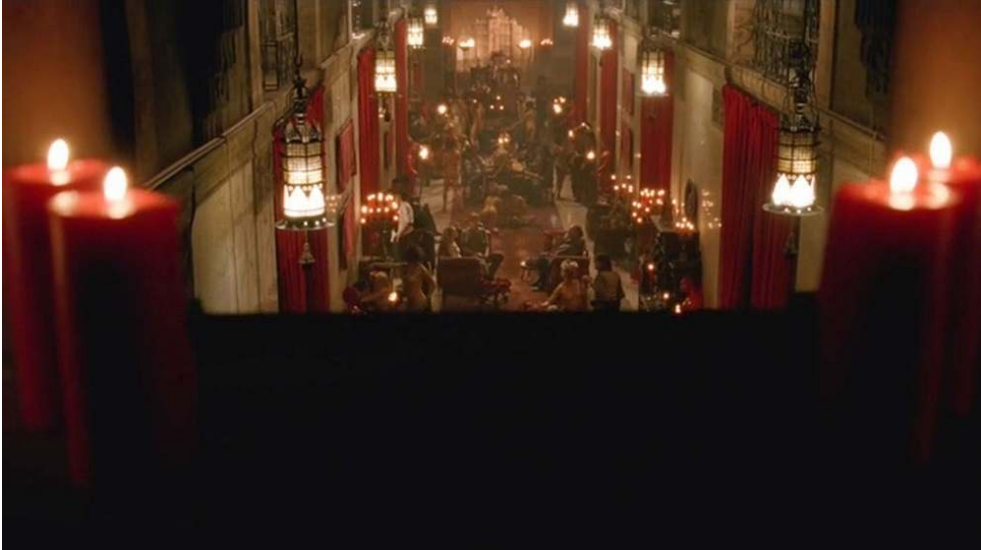
Fig. 6 : Panoramique vertical sur le parterre orgiaque (S01E05).