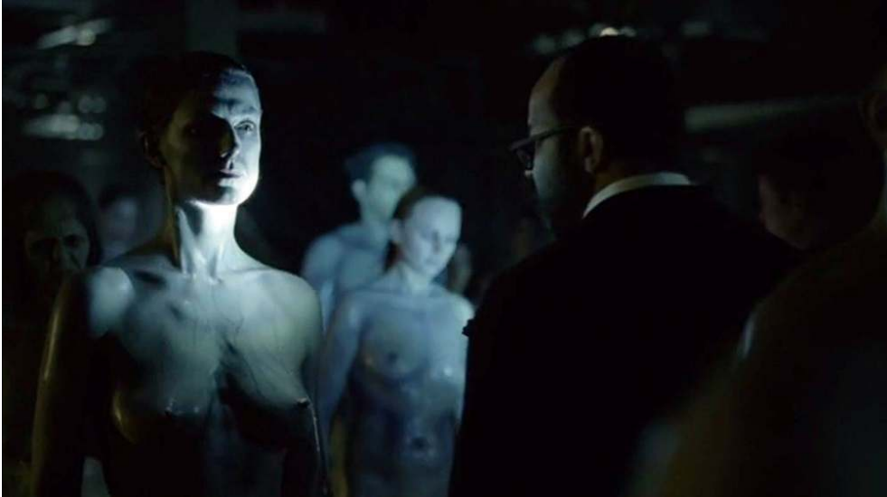
Fig. 2 : Visite de la réserve d'hôtes désactivés (S01E01).