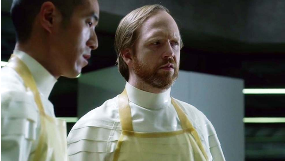
Fig. 31 : Felix et Sylvester hypnotisés par l'extase de Maeve (S01E06).

représentation sexuelle ne peut se contenter d'exposer des corps qui s'enchevêtrent mécaniquement.