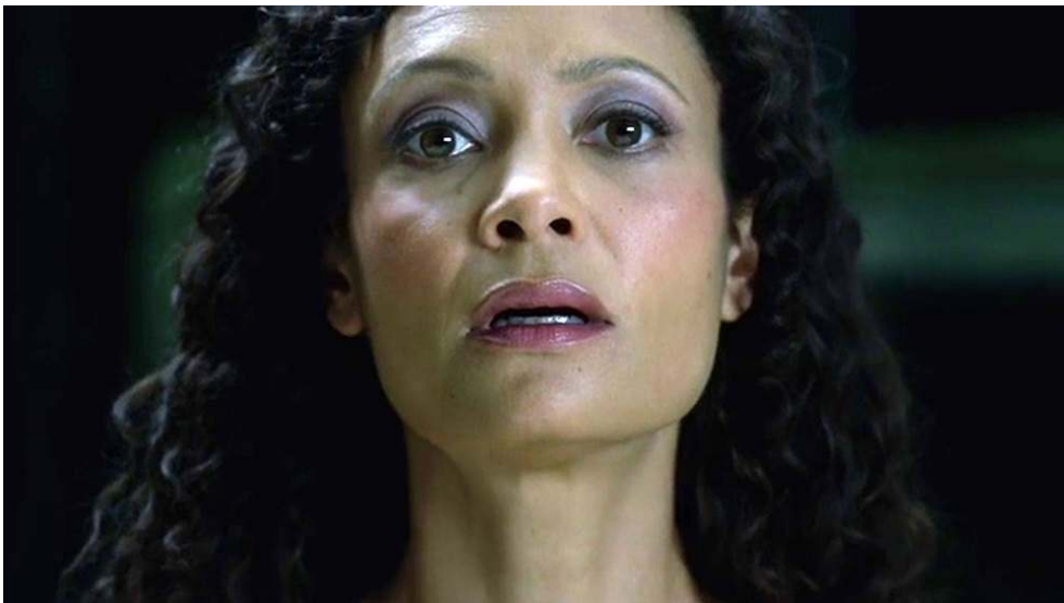
Fig. 29 et 30 : Mouvement de caméra torsadé passant du fessier au visage de Maeve (S01E06).