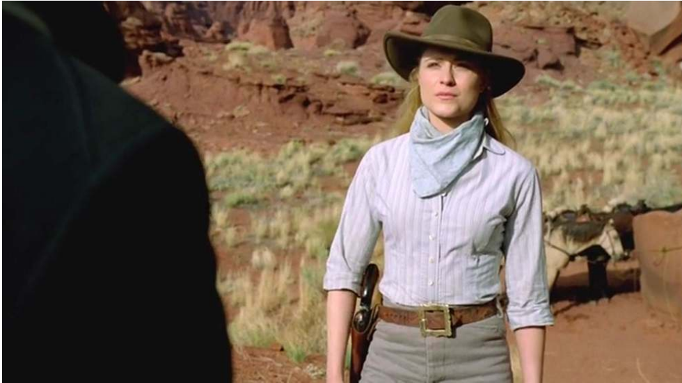
Fig. 5 : Dolores en tenue de bandit de grand chemin (S01E05).

même on a tendance à considérer, en langage scénique, que « l'habit fait l'acteur » et l'aide à entrer dans la peau de son personnage, Dolores semble pour sa part bien en peine de se fondre dans cette nouvelle carapace et de convertir ce qui s'apparente pour l'heure à un déguisement en tenue de tous les jours.