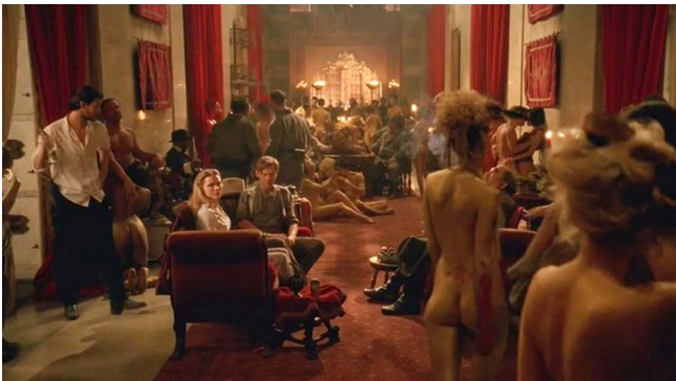
Fig. 10 et 11 : Glissement de l'attraction vers la narration (S01E05).