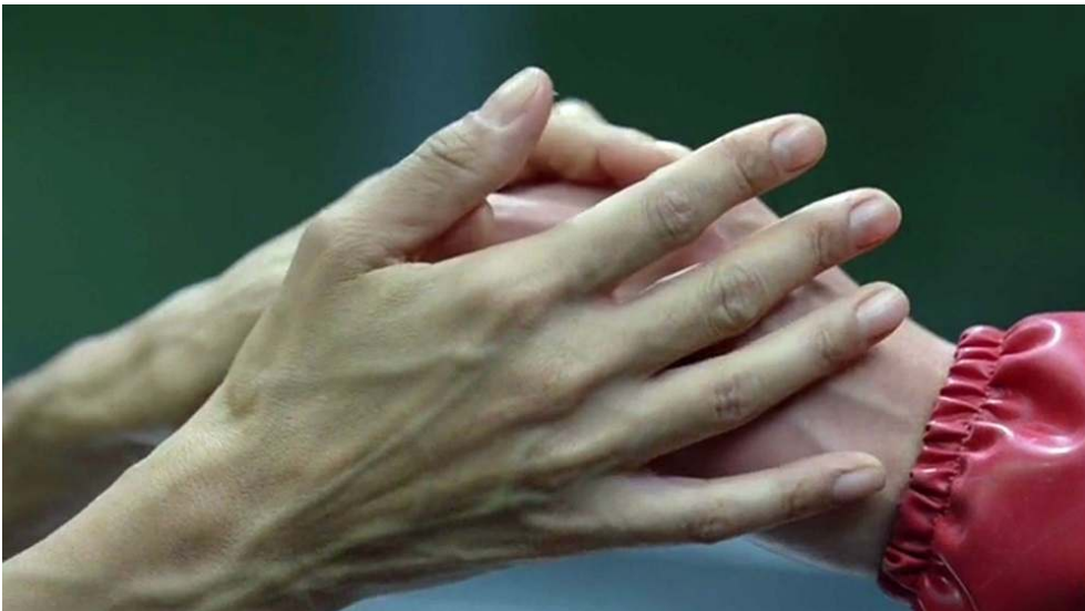
Fig. 22 : Gros plan de la main de Maeve saisissant celle de Felix (S01E06).