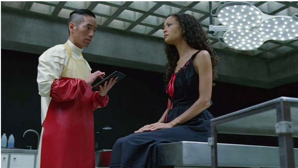
Fig. 25 : Maeve vêtue d'une robe de soie noire (S01E06).