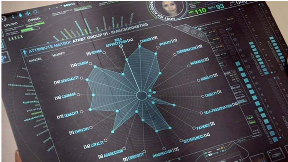
Fig. 26 : La matrice d'attributs ontologiques de Maeve (S01E06).

bulletin scolaire, de 0 à 20 : 18 en charme et en sensualité, 17 en ténacité, 16 en loyauté, 15 en courage, mais seulement 3 en patience et en humilité, 2 en mansuétude et 1 en cruauté (Fig. 26). Autant de données chiffrées, jusqu'alors totalement abstraites, qui ont depuis sa « naissance » défini son caractère (ou character ) et guidé chacune de ses réactions sans même qu'elle s'en soit rendu compte.