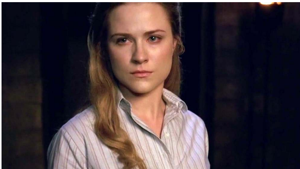
Fig. 15 : Panoramique de bas en haut sur Dolores (S01E05).