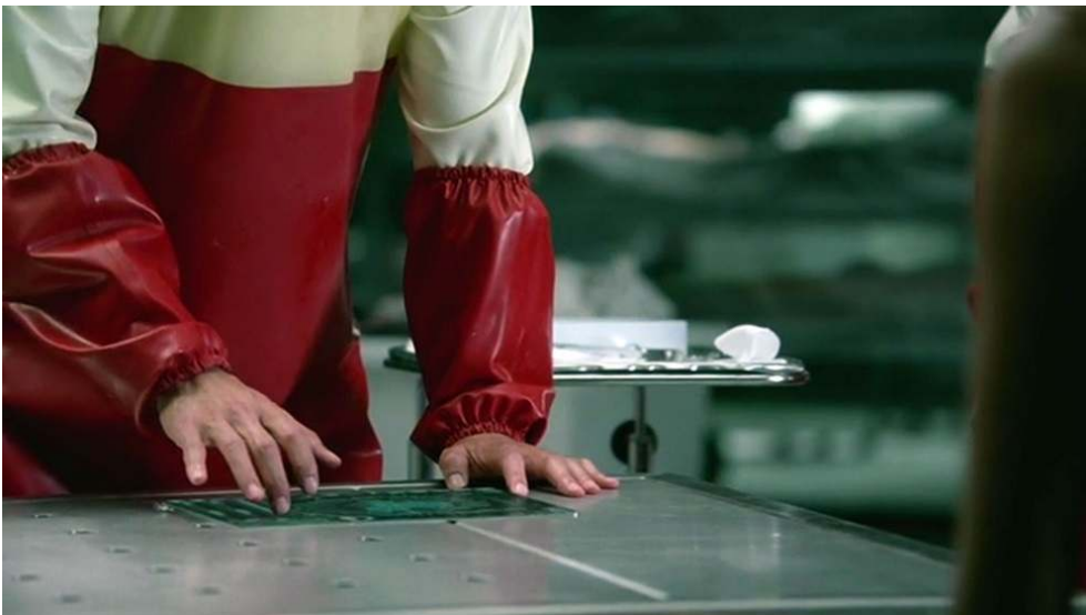
Fig. 28 : Felix pousse l'aperception générale de Maeve (S01E06).