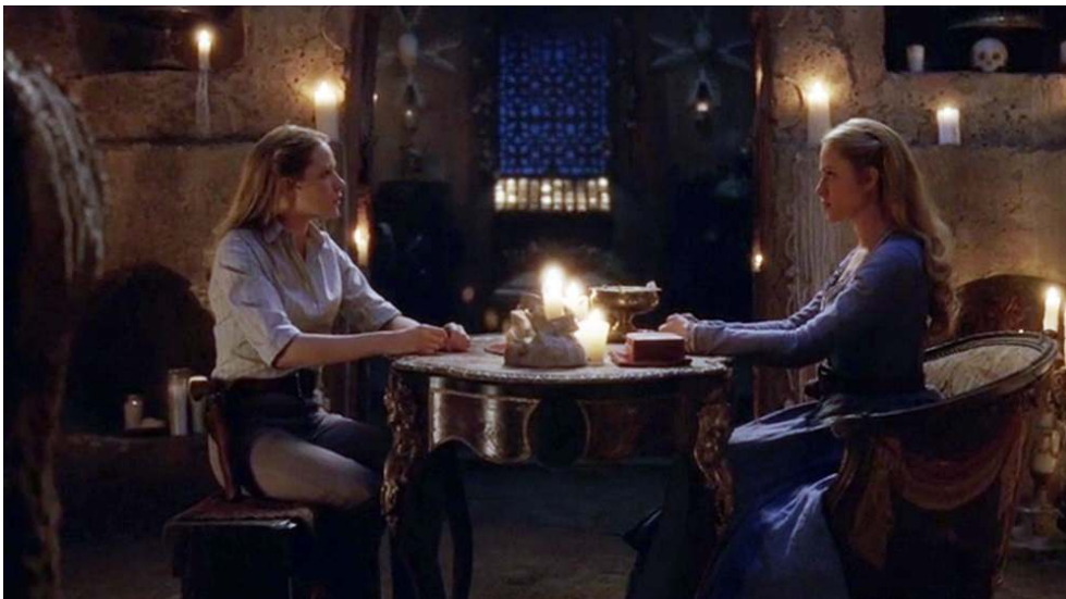
Fig. 12 : Plan en miroir des « deux » Dolores (S01E05).