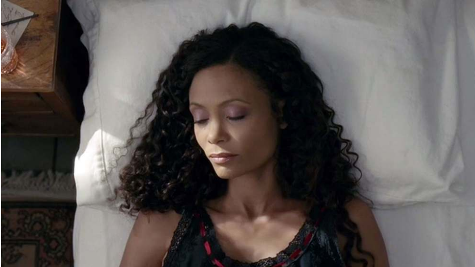
Fig. 19 et 20 : Dolores et Maeve au réveil, face caméra (S01E01 et S01E06).