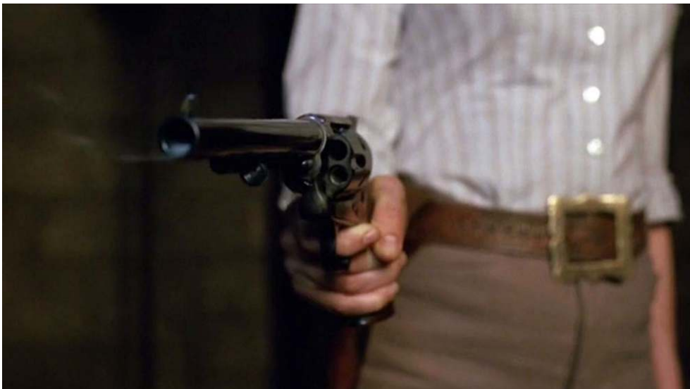
Fig. 13 : Gros plan du revolver de Dolores (S01E05).