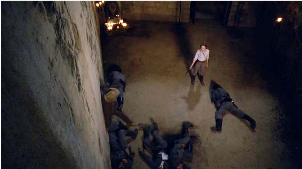
Fig. 16 : Plongée à hauteur de plafond sur Dolores (S01E05).