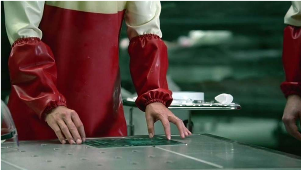
Fig. 27 : Felix place la tablette dans l'axe de son pénis (S01E06).