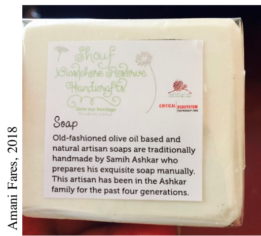
Figure 3 Etiquette indiquant la méthode traditionnelle de fabrication par l'artisan S.A..