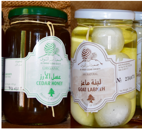
Figure 8 Produits locaux labélisés par le symbole de la région (le cèdre du Chouf)