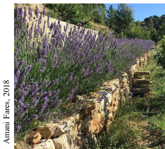
Figure 4 Restauration des terrasses abandonnées et culture de Lavande

abandonnées, particulièrement propices à cette culture. Dans les entretiens effectués avec R.R., cette restauration des terrasses semble constituer un objectif important car elle sous-tend la restauration du paysage agricole original de la région (Fig. 4). Avec son mari, architecte de métier, R.R. a donc entrepris de reconstruire les murs en pierre sèche en respectant les savoir-faire traditionnels. La lavande, cultivée sur l'extérieur des terrasses, a été associée à l'origan ( Za'atar plante aromatique très connue dans la cuisine libanaise), planté contre les murs de soutènement, et à des arbres fruitiers pour une optimisation de l'irrigation.