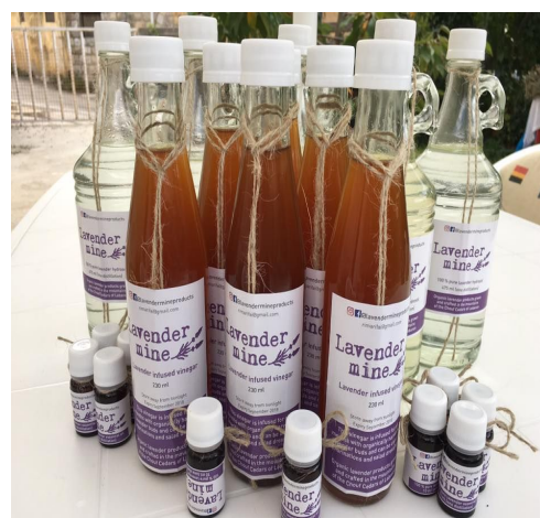
Figure 5 Produits à base de lavande : huile essentielle, eau de lavande, vinaigre.

Cette production récente de lavande ne représente encore qu'un tout petit volume et ne concerne qu'une seule productrice. Commercialisée depuis peu sous la marque Lavender Mine (Fig. 5) en vente directe ou en circuits courts à Beyrouth, elle commence à être reconnue localement. Les liens d'interconnaissances, la mobilisation des réseaux sociaux dématérialisés (site internet dédié) et la participation dans les foires et les festivités locales ont joué un rôle important dans la réputation du produit auprès des consommateurs à la recherche de produits de qualité et issus d'une agriculture biologique.