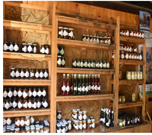
Figure 9 Boutique de vente des produits de Parc à l'entrée de forêt de cèdre (Barouk)

Les liens entre la production et le territoire sont fortement mis en avant pour affirmer la spécificité et l'ancrage territorial des produits concernés. La Réserve, et derrière elle, les producteurs ne mettent pas seulement en avant les liens physiques de leurs produits au lieu de production, mais aussi les savoir-faire de production ainsi que les traditions culinaires et culturelles propres aux montagnes du Chouf. Ces liens à la fois organiques et culturels, pensés et explicités, témoignent auprès des consommateurs de la typicité des produits et permettent aux producteurs de différencier leurs productions et de justifier leur spécificité. Ils renforcent aussi l'identité agri-culturelle du lieu de production (la Réserve) tout en renforçant et en enrichissant sa vocation touristique, car les produits sont aussi présentés dans les grands événements agritouristique, comme le festival Jabalena qui se déroule chaque année début septembre à Maasser el-Chouf et qui rassemble des milliers des personnes de toutes les régions du pays (Fig. 10).