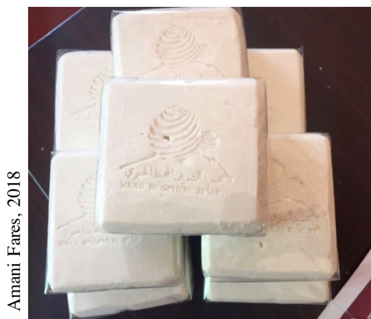
Figure 2 Savon artisanal à base d'huile d'olive avec le logo de la Réserve du Chouf

Pour asseoir la spécificité territoriale de son savon, S.A. convoque moins les spécificités biophysiques du territoire que les références aux savoir-faire et aux traditions familiales. La réputation de son produit est directement liée au respect des procédés traditionnels et à l'authenticité de la fabrication, qui confèrent au savon, fait « dans les règles de l'art » (à partir de soude et d'huile, sans parfums ni colorants), une qualité « originale », « naturelle », « locale », et donc supérieure à ce que peut fournir l'industrie (Fig. 2). Cette réputation est reconnue de longue date par les consommateurs locaux et procure une valeur ajoutée au produit. On note ici l'importance de la proximité, c'est-à-dire des réseaux et des rapports sociaux liant le producteur à des consommateurs qui partagent le même ensemble de valeurs et de traditions, qu'il s'agisse de personnes appartenant au village de S.A. ou de personnes géographiquement éloignées mais appartenant à la même communauté. L'intégration de ce savon dans le panier des « Produits de Parc » de la Réserve du Chouf est le fruit de cette réputation. Cette reconnaissance institutionnelle est une garantie pour les consommateurs de l'extérieur de la région d'un produit artisanal et traditionnel qui évoque le savoir-faire, la petite quantité et le non-standardisé (Fig. 3).