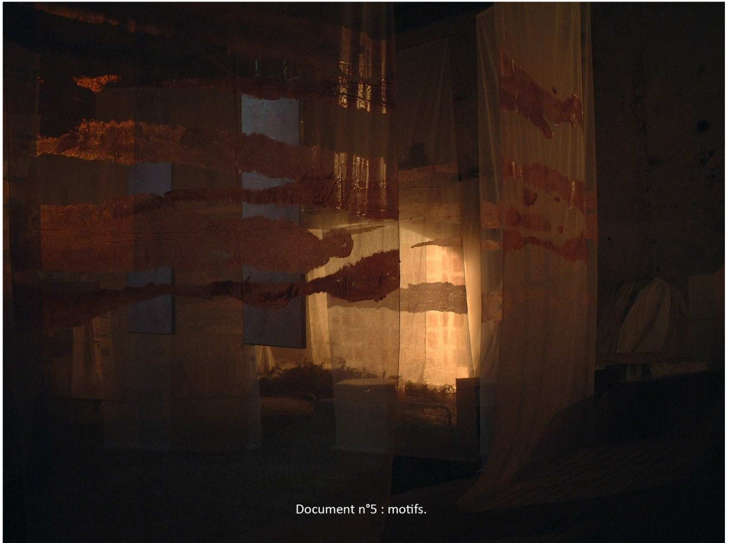
Document n°5 : motifs.