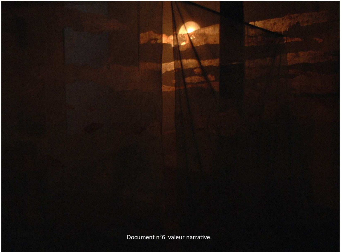
Document n°6 valeur narrative.