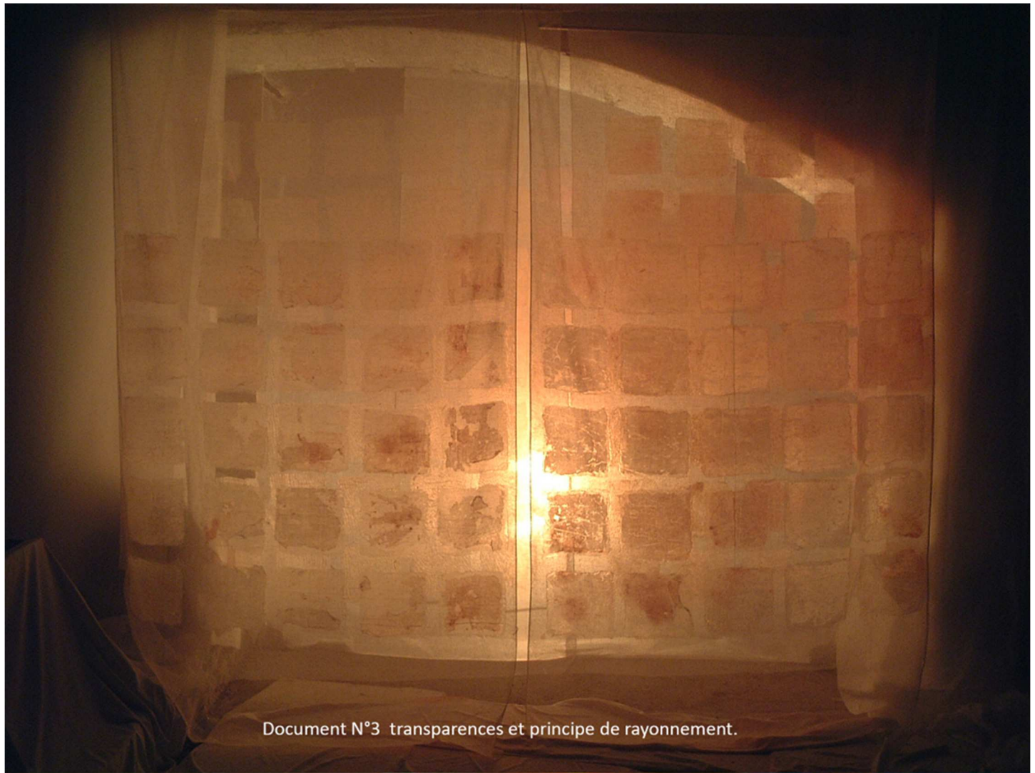
Document N°3 transparences et principe de rayonnement.