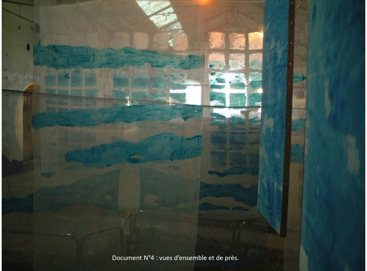
Document N°4 : vues d'ensemble et de près.