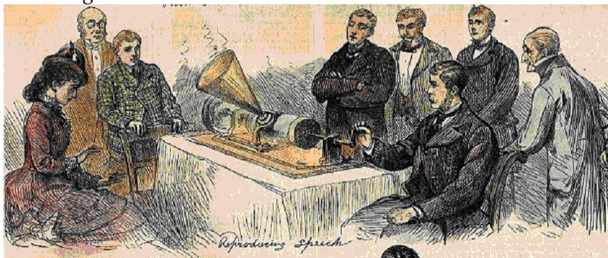
Figure 4 – La présentation du phonographe à la presse (février 1878) 12

On est loin des usages professionnels d'Edison, mais aussi de notre marché du disque... En revanche, d'autres ont les pieds sur terre : « It is too soon to say what may be the use of this strange instrument ».