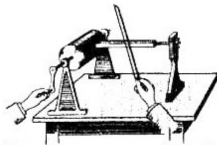
Figure 1 : l'enregistreur graphique des sons de Thomas Young (1807)

La représentation graphique des sons, après cet épisode, ne commence réellement qu'au tout début du XIX ème siècle, elle est décrite en 1807 par un célèbre savant anglais, Thomas Young (fig. 1). Professeur de physique à Londres, il imagine un dispositif destiné à montrer à ses étudiants la figure d'un mouvement vibratoire (YOUNG, 1807)