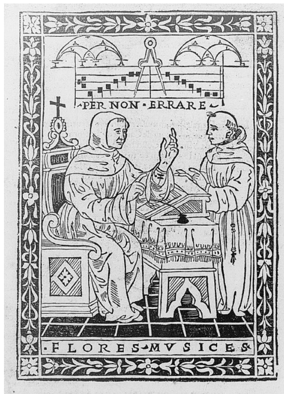
Figure 2 - Le frère Pierre de Canuntis enseignant la musique. Regule florum musices , Florence : Bernardum Zuchettam, 1510.

Mei était avant tout passionné de littérature grecque, et son évolution vers une théorie esthétique de la musique reste très liée à la poésie et aux textes. Il s'agissait là d'un courant d'idées implanté notamment à Rome, avec Nicola Vicentino. Il est clair que Vincenzo, qui sera en quelque sorte l'élève de Mei, restituera cette passion pour le texte dans son approche de la musique vocale. Mais Vincenzo était également un 'travailleur manuel', et c'est Mei qui va lui suggérer de procéder à des expériences, notamment sur l'étude des intervalles.