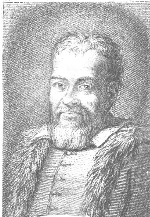
Figure 1 - Vincenzo Galilei 1520-1591