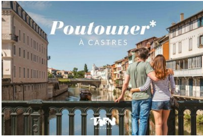
Illustration 2. Affiche de la campagne de promotion touristique Tar, cœur d'Occitanie

Il s'agit aussi bien dans l'affiche publicitaire McDonalld's que dans le spot celle de Quézac de développer des stratégies d'exploitation du patrimoine linguistique/culturel afin d'ancrer