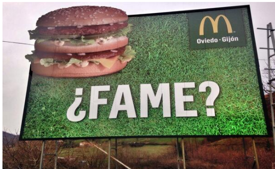
Illustration 1. Affichage de McDonald's en asturien : « Faim ? »

On observe en effet actuellement que la sollicitation de la langue/culture minoritaire dans la présentation ou la publicité d'un produit peut répondre à des stratégies (purement) commerciales. On parle alors de « marchandisation » ( commodification en anglais, Heller 1999).