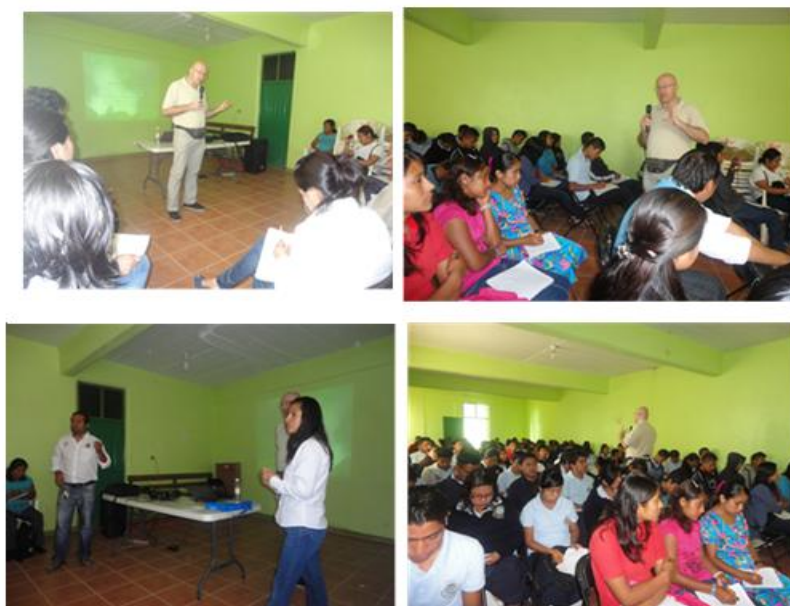
Figure 2 : Présentation de l'activité de l'atelier M.A.S.C. par JLL et les responsables pédagogiques du BIC n° 26 de San Andrés Solaga