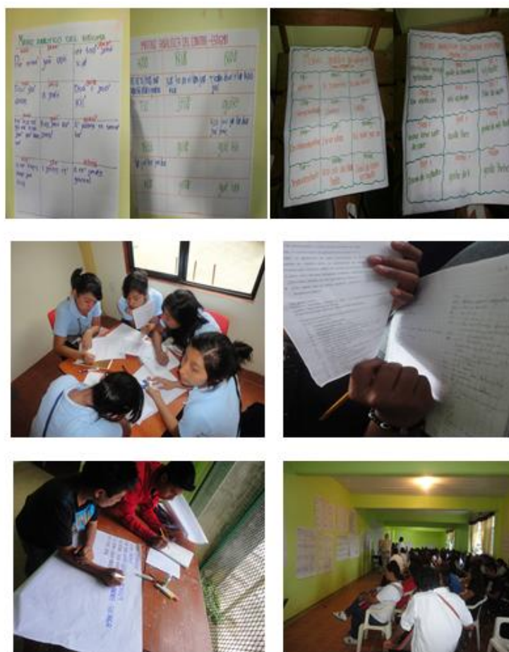
Figure 3 : Groupes de travail chinantecs et zapotecs au cours de l'atelier M.A.S.C., puis assemblée (en bas à droite) : grille d'analyse du stigmatisme et du contre-stigmatisme selon Goffman