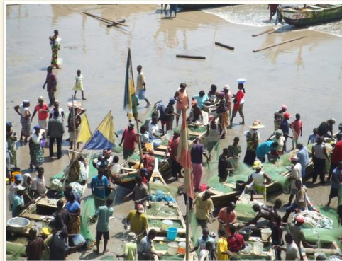
Fishing boats. Fishermen selling their catch at Abandze, Ghana, the site of the first British trading

The Atlas of Pidgin and Creole Language Structures (APiCS) provides expert-based information on 130 grammatical and lexical features of 76 pidgin and creole languages from around the world.