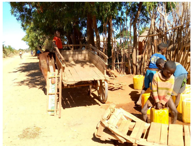
Fig. 4. Transport de bidons jaunes en charrette, faisant le tour de la ville pendant les périodes de pénurie, à Betioky-Sud.

ces derniers le matin ou la veille pour réserver une place dans la file d'attente.