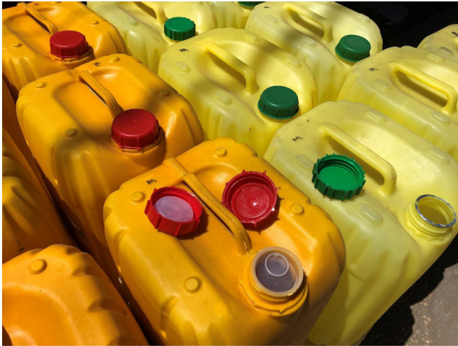
Fig. 1. Bidons vides vendus à Ankilifaly, Toliara.

ou en cours de nettoyage. À cette date, les bidons vendus étaient de deux types différents : ceux de la marque d’huile Rajah, jaunes transparents, et ceux de la marque d’huile Dyanas, plus foncés et plus opaques, avec un bouchon plus hermétique (Fig. 1).