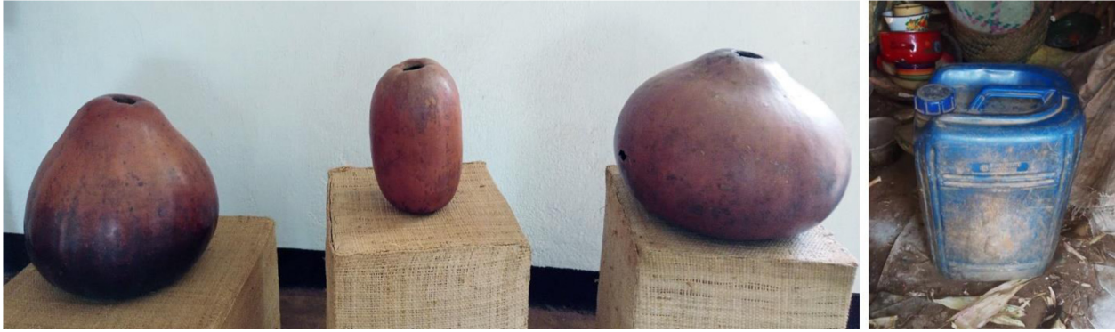
Fig. 2. Exemples de contenants d'eau dans le sud de Madagascar avant l'arrivée des bidons jaunes : calebasses au musée Arembelo de la réserve de Berenty et bidon bleu encore utilisé dans la commune rurale de Soahazo.