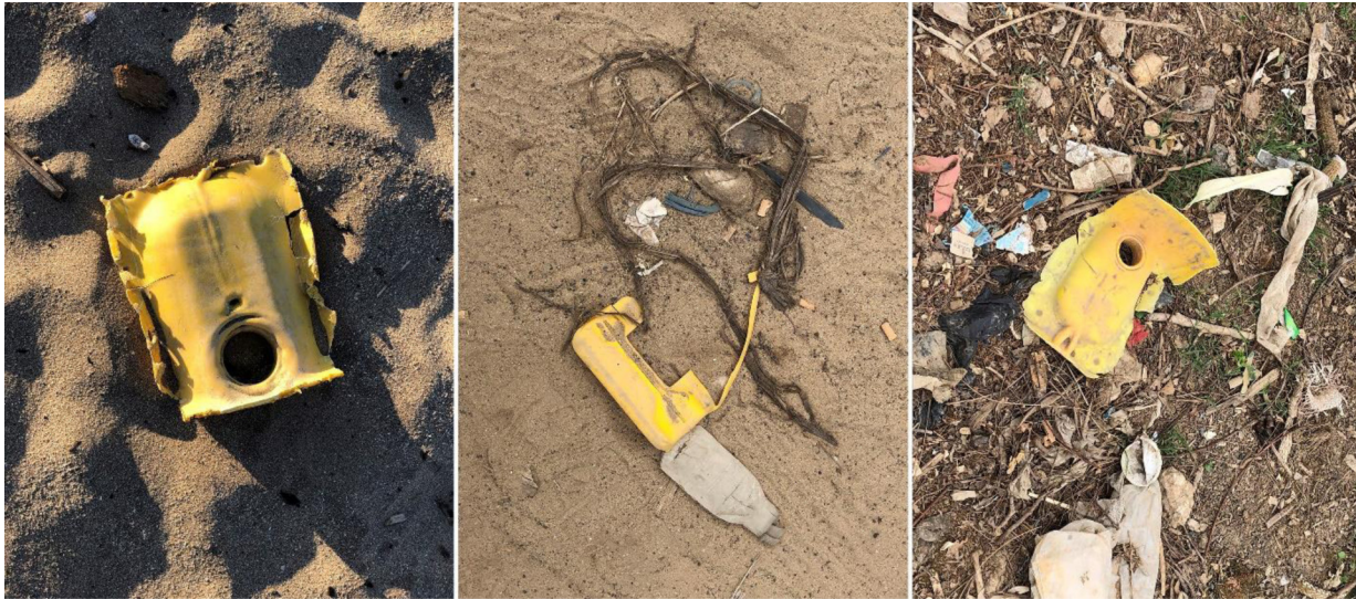
Fig. 8. Divers macrofragments de bidons jaunes devenus déchets sauvages.

(y compris pour réparer d'autres bidons endommagés 10 ). Ces macrofragments sont sans doute le résultat de la dégradation progressive du plastique sous l'effet combiné de «la lumière du soleil, [d]es écarts de température, [d]es contraintes mécaniques et [de] l'activité biologique» (Fanon, 2019).