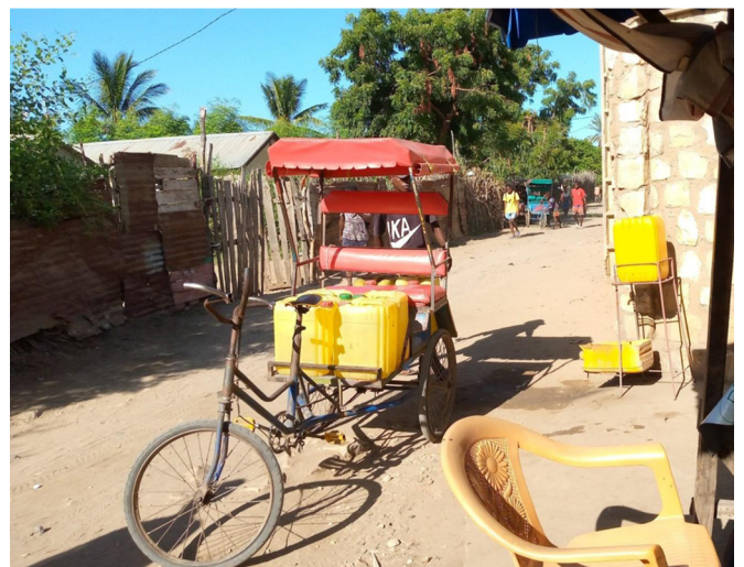
Fig. 5. Transport en cyclo-pousse de bidons jaunes achetés à un particulier branché à la Jirama.

Les bidons jaunes sont souvent marqués par leurs propriétaires : ces derniers y apposent par exemple leurs initiales ou le numéro de leur étage ou de leur logement, au marqueur ou au couteau (Fig. 6 ; voir aussi Moussa, 2022 ; Schmidt, 2021). Ce marquage vise à éviter les substitutions, sources de conflits de voisinage. En effet, certaines personnes disposent de bidons plus récents ou mieux entretenus et ne souhaitent donc pas les voir échangés contre des bidons en moins bon état lors du remplissage à la