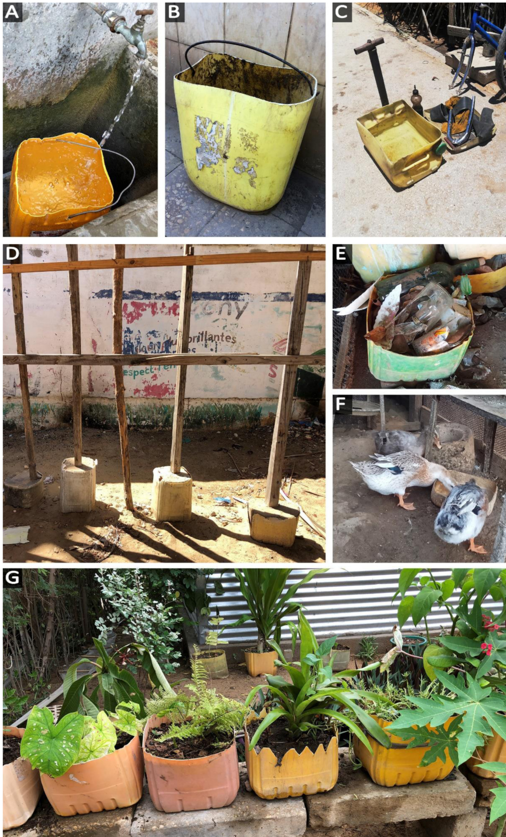
Fig. 7. Divers usages de bidons jaunes détériorés. A : seau d'eau ; B : seau pour les travaux ; C : cuvette d'un réparateur de vélos ; D : plots remplis de béton ; E : bac à ordures ; F : mangeoire pour des animaux ; G : jardinières.