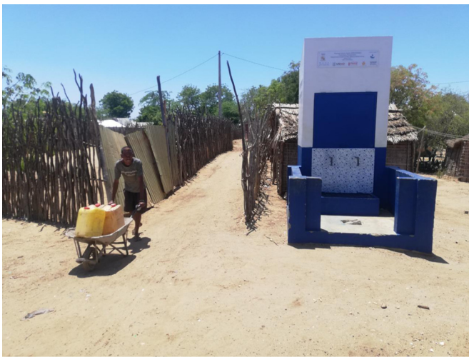
Fig. 3. Transport de bidons jaunes en brouette depuis une borne-fontaine créée en mars 2022 à Toliara.