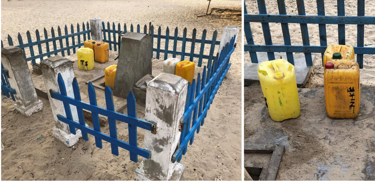
Fig. 6. Bidons d'eau marqués par leurs propriétaires à Sarodrano, à environ 30 km au sud de Toliara.

borne-fontaine ou lors de l'utilisation dans des parties communes (par exemple, dans des sanitaires partagés).