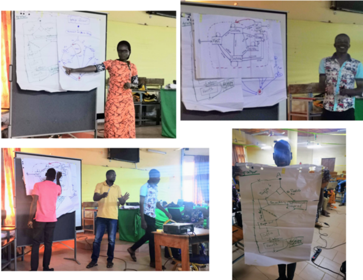
Photo 5 : présentation des différents diagrammes dynamiques par les groupes

Le jour suivant, chaque groupe a alors présenté ses propositions de schéma. Elles ont alors été collectivement discutées, débattues et révisées dans le but d'aboutir à un modèle conceptuel qui convienne à l'ensemble des participants. Les débats ont souvent été très animés, ce qui révèle bien que la question des conflits entre élevage et agriculture est un sujet sensible au Bénin.