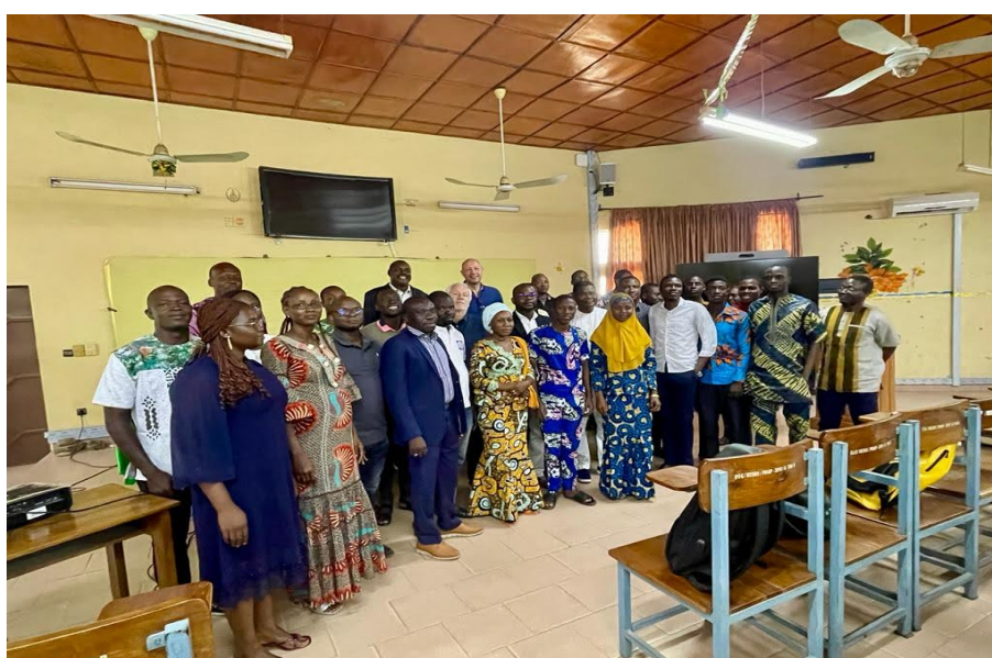
Photo 3 : Ouverture de la formation avec l'ensemble des participants

L'annonce de cette formation auprès des étudiants de l'université a recueilli un grand succès et plus de 100 candidatures ont été reçues. Afin de réduire le nombre de participants, les organisateurs ont éliminé les étudiants n'ayant pas de Master. Ils ont ensuite éliminé les candidats dont les lettres de motivations ne correspondaient pas suffisamment au profil de la formation. Au total, 37 participants ont été sélectionnés (voir liste en annexe), principalement des doctorants, des docteurs et des enseignants-chercheurs.