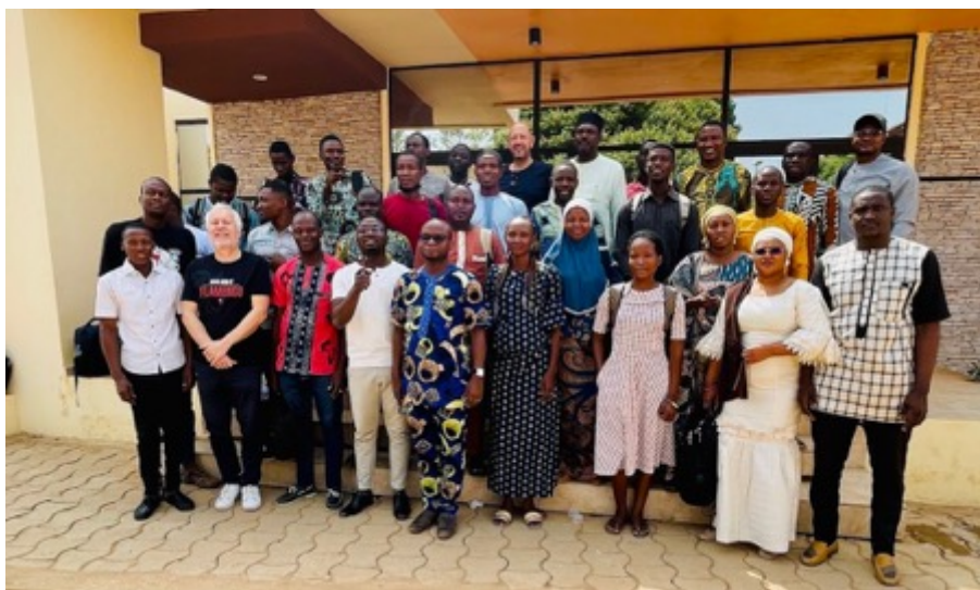
Photo 8 : Photo de tous les participants, prise le dernier jour de la formation