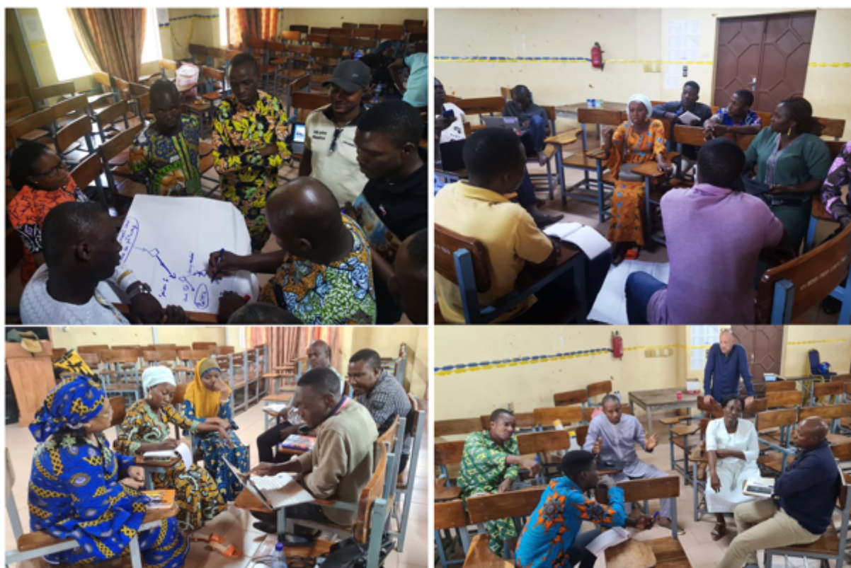
Photo 4 : Quatre groupes travaillant sur la conception du prototype

À partir de cette description, les groupes constitués ont dû concevoir plusieurs diagrammes de classes UML afin de décrire sans ambiguïté la structure du modèle conceptuel qu'ils avaient en tête. Par ailleurs, et afin de représenter l'ensemble du fonctionnement du modèle, chaque groupe a été en charge de concevoir un diagramme d'activité ou d'état-transition représentant chacun une partie de la dynamique du modèle. Par exemple, un groupe devait décrire de façon formelle les différents états possibles d'une parcelle et les événements déclencheurs de changement d'état, quand un autre groupe devait représenter les activités d'un agent éleveur ou d'un agriculteur.