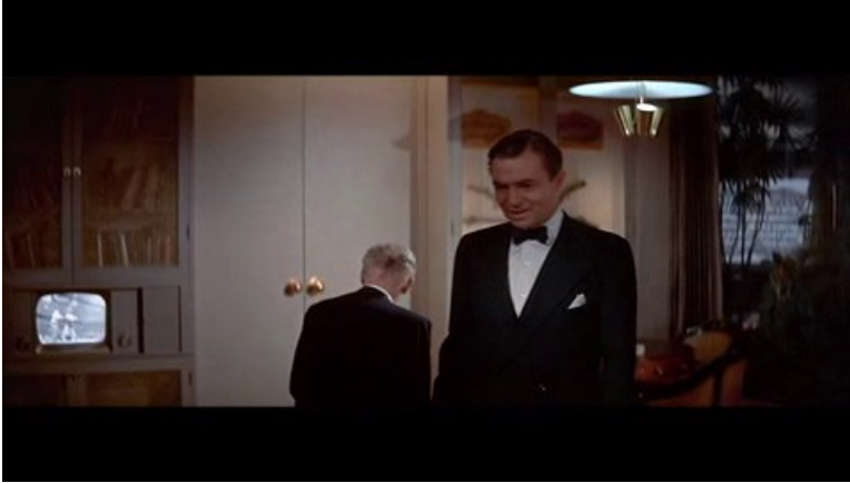
Figure 2. A Star Is Born (Cukor, 1954) : La Star prise entre 2 médias.