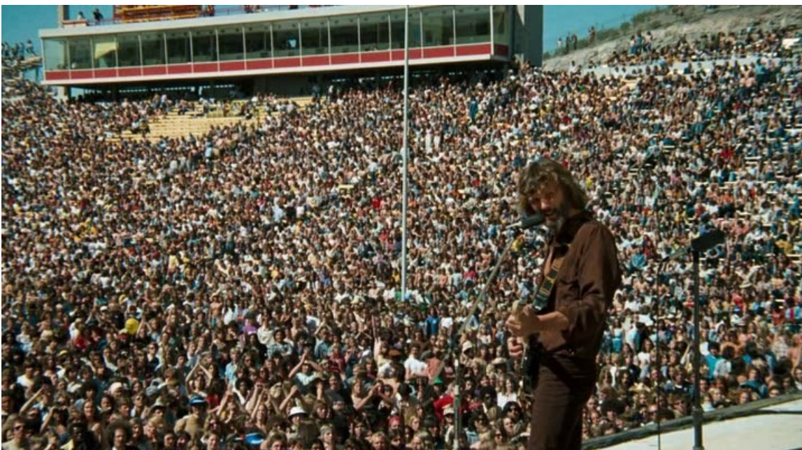
Figure 3. A Star Is Born (Pierson, 1977) : La Star de cinéma dans l'arène musicale.