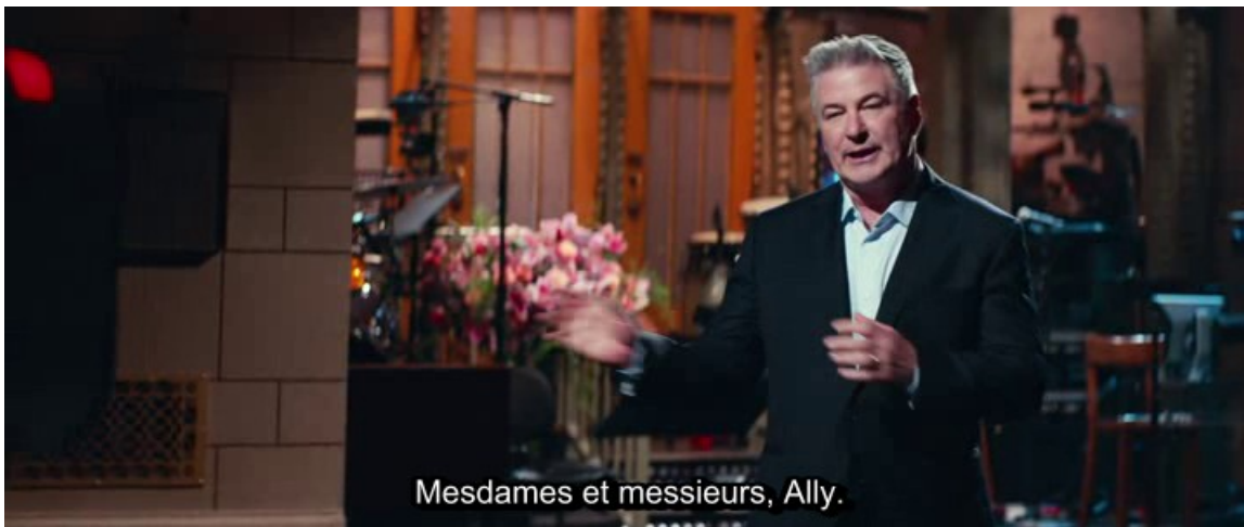
Figure 4. A Star Is Born (Cooper, 2018) : Miroitement de la Star entre cinéma et télévision.

Toutefois, l'intérêt de cette dernière version réside en la personne de Bradley Cooper, acteur et réalisateur, qui utilise le film pour deux motifs majeurs : il s'agit du premier rôle hollywoodien pour Lady Gaga, déjà artiste musicale reconnue et actrice de série télévisée également reconnue avec un Golden Globe à son actif, et il s'agit pour Bradley Cooper, lui aussi star établie, de montrer toute l'étendue de son talent dans un registre tragique, en tant qu'interprète musical, et également, et surtout, en tant que réalisateur. Cette double innovation (premier grand rôle au cinéma pour Gaga et première réalisation pour Cooper) est tempérée par la dimension de remake qui assure, par les noms connus et l'histoire déjà reconnue, une prise de risque financière minimale pour le studio. A Star is Born remporte quatre cents trente-quatre millions de dollars dans le monde avec un budget de production de trente-six millions et un coût de promotion estimé à cent-dix millions. Le film, comme ses versions précédentes, reçoit également huit nominations aux Oscars et remporte l'Oscar de la meilleure chanson originale pour « Shallow », comme « Evergreen » de Streisand et Williams en son temps. Ce dernier titre remporte également un Grammy Awards, et le réel vient se conformer à la fiction une fois de plus, illustrant la force du véhicule hollywoodien qui sert désormais, depuis les années 1970, de support promotionnel à l'industrie de la musique, alliée du cinéma et de la télévision.