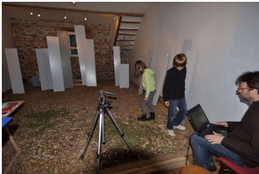
Mas Saint Jacques, atelier Domergue, travail sur une installation vidéo Exil(s) , séance de 2010. Famille Villagordo.

L'atelier est-il une utopie localisée ? Au sens où Foucault parle d'hétérotopie dans une conférence devant des architectes en 1966 6 ; il appelle hétérotopie tout lieu à part, faisant que le temps se suspend ou se modifie pour une activité qui serait de l'ordre des imaginaires (comme au théâtre) : c'est la cabane dans les arbres, la tente d'indiens faite sur un lit, le grenier, le fond du jardin : ce sont les territoires ludiques des enfants . Il rajoute aussi, on le sait, les cimetières, les prisons et les jardins d'agrément.