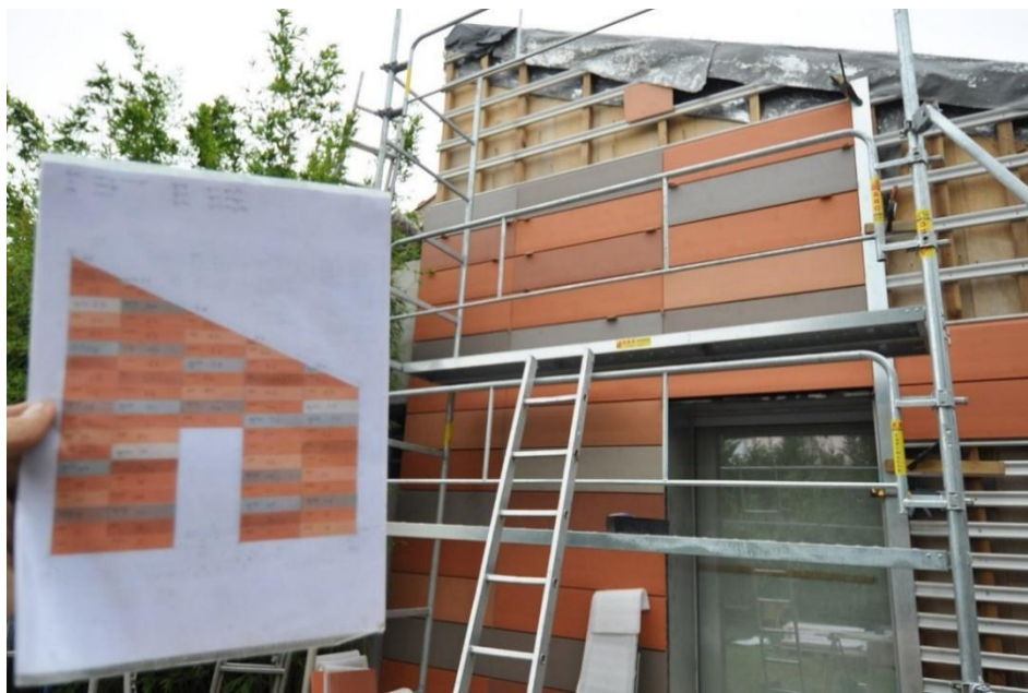
Rénovation de l'atelier. Plan de la façade, mécénat d'entreprise de la société Terreal, spécialisée en revêtements de terre cuite, 2014.

Dans ce cadre mental, Domergue a mis en place une démarche au long cours d'aménagement de son lieu de vie et de création, faisant comme il le dit, de ce lieu une œuvre d'art en soi. L'atelier peut être défini comme œuvre, chaque façade étant un projet d'invention esthétique, pour lequel il faut trouver des financements publics ou privés, faire des emprunts bancaires.