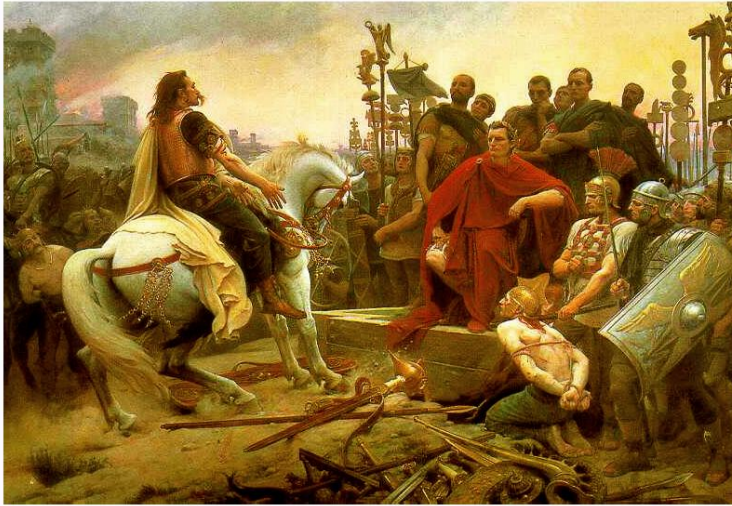
Image 1. Lionel Royer, Vercingétorix jette ses armes aux pieds de César , Huile sur toile, 321 x 482 cm, Musée Crozatier, Le Puy-en-Velay, France, 1899.

Nous pourrions dire que les œuvres de l'enquête culturelle sont là pour tout d'abord interroger les élèves, pas pour illustrer une leçon, un propos, ou un déjà-là stéréotypé. La peinture de Royer, comme toute peinture d'histoire au XIX e siècle, contient une hétérogénéité temporelle (Didi-Huberman, 2002), la forme parle de la troisième République, le fond de l'Antiquité. Une œuvre d'une époque qui parle d'une autre époque, comme un film du genre péplum antique donne également à voir une technologie cinématographique qui n'a rien à voir avec l'Antiquité.