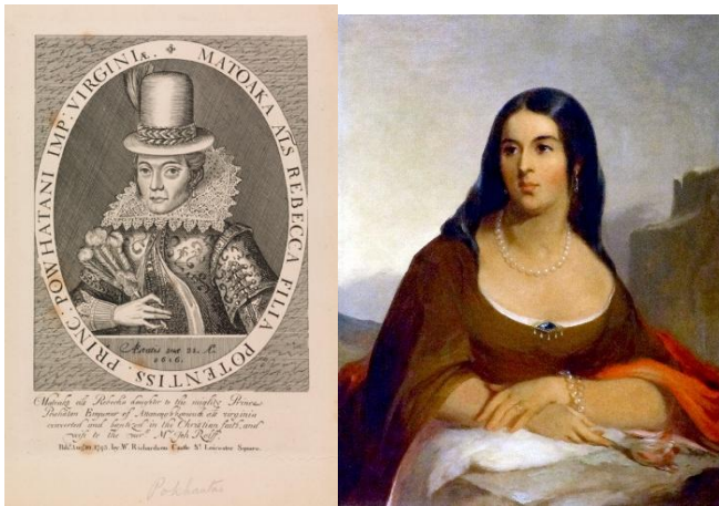
Images 2 et 3. Portraits de Pocahontas

Gravure de 1616 de Simon Van de Passe ; peinture de Thomas Sully, vers 1700