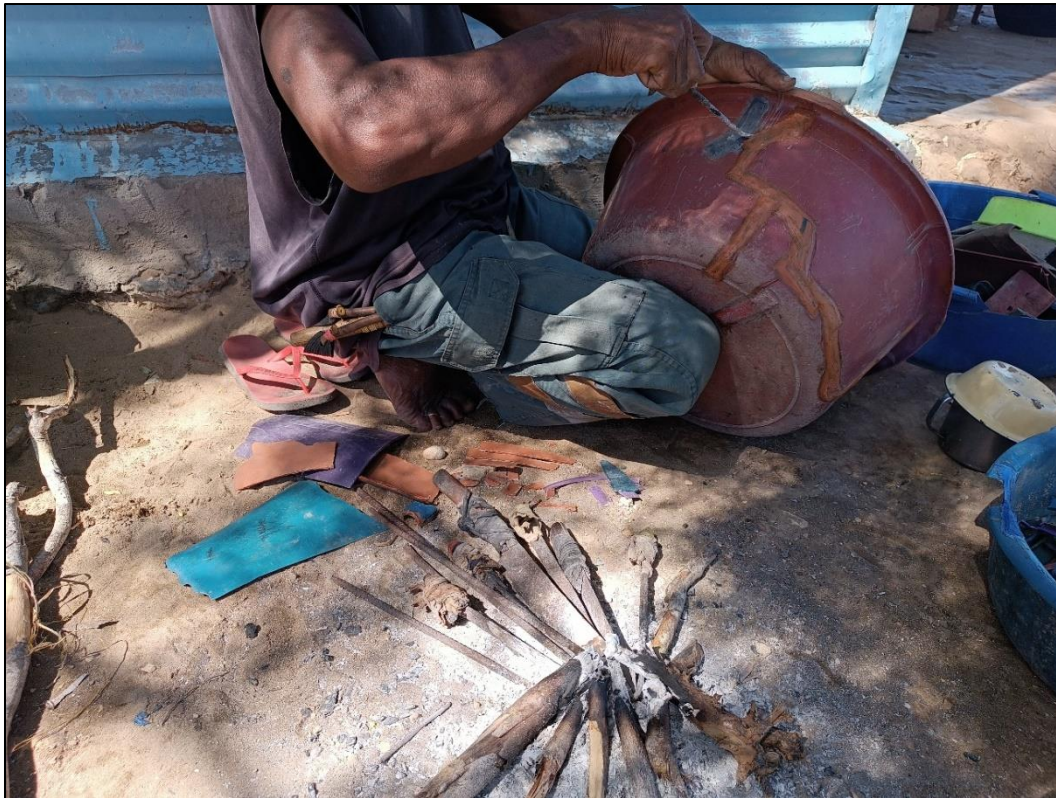
Figure 4 : Réparation d'une bassine en plastique (A.S. Djahere, 2023)