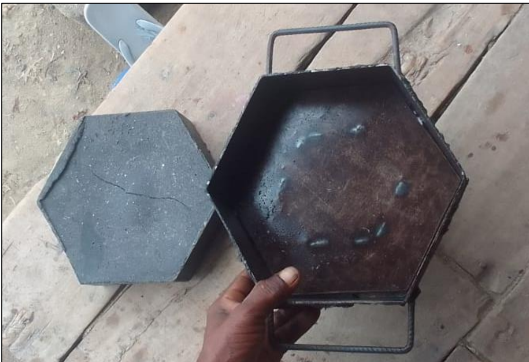
Figure 3 : Moule et pavé autobloquant à Sarodrano (E.F. Veriza, 2023)