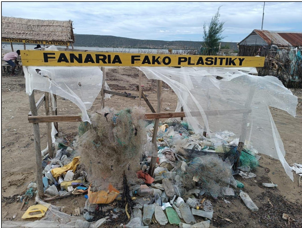
Figure 2 : Abri de « valorisation des déchets plastiques » à Sarodrano (E.F. Veriza, 2023)

mesure de le payer suffisamment pour couvrir le coût du bois de chauffe et du charbon dont il a besoin pour ses réparations, mais aussi lui assurer un revenu suffisant.