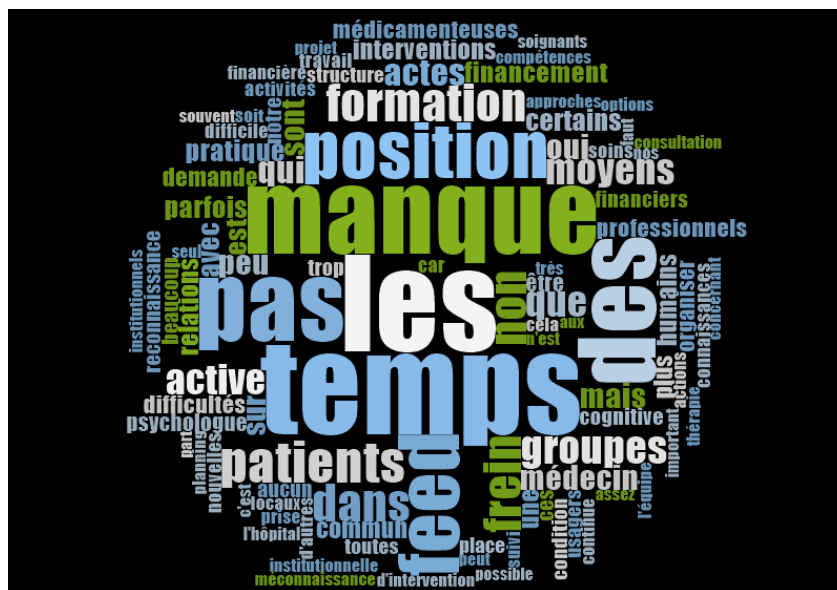
Figure 2 : Les freins concernant le recours aux INM. L'analyse lexicale par fréquence de mots met principalement en avant le manque de temps et de formations

Dans la figuration par nuage de mots, les mots « temps » et « manque » sont les plus fréquents.