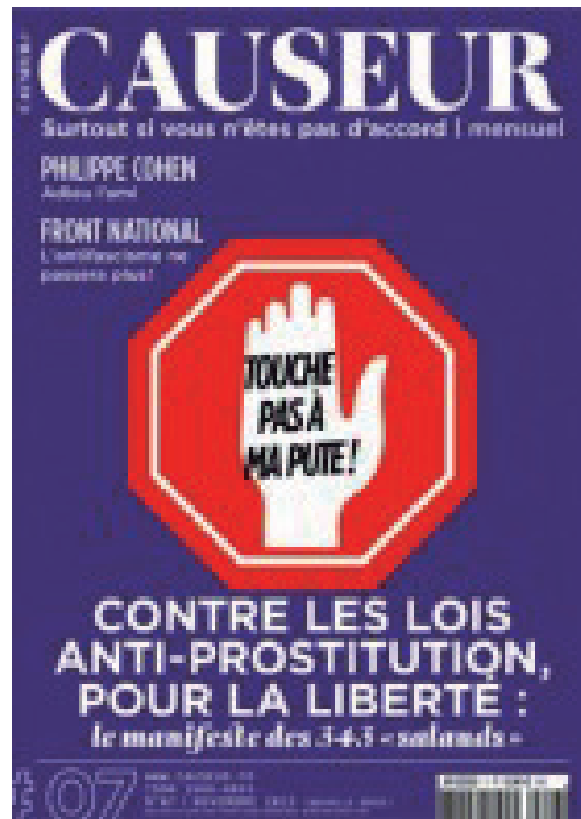
Figure 7. Un palimpseste en couverture de Causeur avec l'identité « Touche pas à [mon pote] ».

A cet égard ce dernier exemple mérite une attention particulière. Le palimpseste a en effet fait l'objet d'une contestation en pertinence discursive. En effet dans le n° suivant du même mensuel Causeur (n° 8, décembre 2013) l'écrivain Alain Finkielkraut explique pourquoi il n'a pas signé le « Manifeste des 343 salauds » intitulé « Touche pas à ma pute » 21 (que diffusait précisément le n° 7 de Causeur ) explicitant ainsi indirectement le fonctionnement sémiolinguistique auquel ont eu recours (de façon erronée selon l'écrivain) les auteurs du « Manifeste » en question, victimes d'un détournement abusif de l'identité :