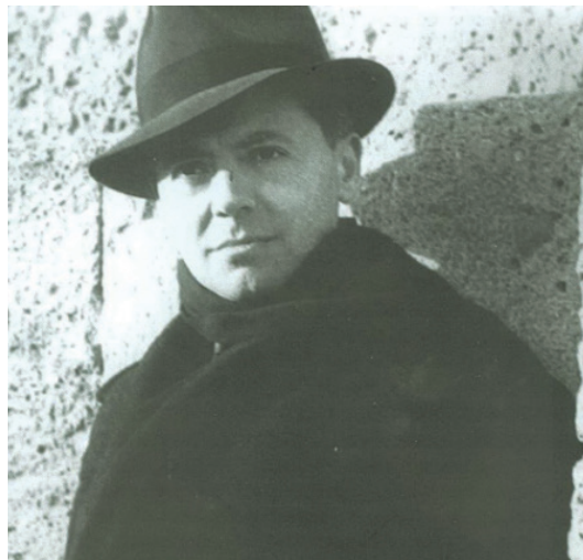
Figure 5. La représentation iconique la plus répandue de l' identitème Jean Moulin.

On doit observer que certain s mots (noms propres comme noms communs) mais aussi des syntagmes, des énoncés, des textes, des chiffres..., y compris des textes scripto-iconiques (voire strictement iconiques) ayant le plus souvent été surexposés historiquement, politiquement... et aujourd'hui médiatiquement (« Vercingétorix », « Jeanne d'Arc », « La Saint-Barthélémy », « L'Alsace et la Lorraine », « L'affaire Dreyfus », « Les plages du Débarquement », « Mai 68 »...) se sont inscrits dans l' imaginaire ethnosocioculturel de la communauté, comme culturèmes mais aussi pour certains comme identitèmes .