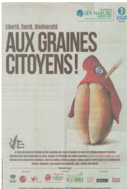
Figure 8. Un palimpseste construit sur l'identité « Aux armes citoyens ! ».