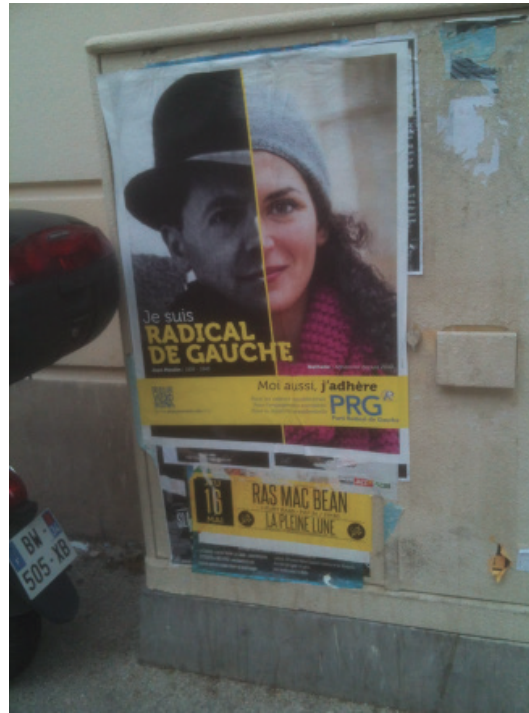
Figure 4. L' identitème Jean Moulin sollicité par les Radicaux de gauche.

Le portrait patrimonialisé de Jean Moulin (une photo prise à Montpellier) est en effet devenu un authentique identitème :