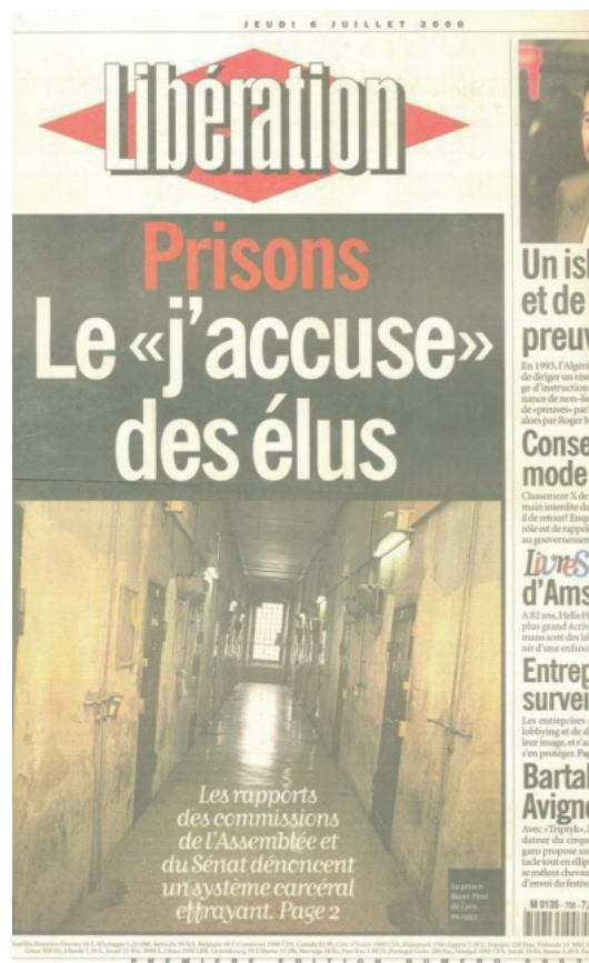
Figure 6. Un palimpseste en Une de Libération avec l' identitème « J'accuse ».

L'énoncé (ou plutôt l' acte d'énonciation ) « J'accuse » est un excellent exemple de patrimonialisation : le titre du célèbre article de Zola dans L'Aurore , à l'origine une énonciation performative, est devenu l'équivalent d'une unité de langue, un mot revêtu d'une charge ethnosocioculturelle qui vise à pérenniser le geste discursif dénonciateur de Zola, symbole de la vigilance des clercs (Boyer, 2008b). Voir ci-après son exploitation en Une de Libération daté du 6 juillet 2000 14 :