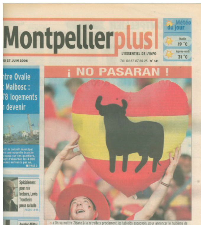
Figure 3. Mobilisation d'identitèmes hispaniques pour conjurer le danger footballistique espagnol.

Arrêtons-nous sur un cas de patrimonialisation relativement récent d'où a émergé l'identitème « Jean Moulin ». Il s'agit d'un cas exemplaire. On observe que la mythification du Chef de la Résistance mort sous la torture sans avoir parlé , à laquelle a largement contribué le célèbre discours – médiatisé – d'André Malraux (prononcé lors du transfert des cendres de Moulin au Panthéon le 19 décembre 1964), s'est focalisée beaucoup plus sur une photographie-portrait que sur le seul patronyme 12 . Cette matrice iconique 13 , reproduite de manière récurrente sur les couvertures d'ouvrages