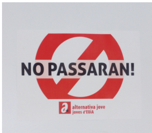
Figure 2. Jeunes indépendantistes catalans contre les forces politiques espagnoles qui leur sont hostiles.

Le document scripto-iconique ci-dessous fait se rencontrer (à l'occasion d'une rencontre de football France-Espagne) deux identitèmes hispaniques à teneur ethnosocioculturelle bien différente : l'un lié à la tauromachie et à la Feria (le taureau de combat) et l'autre, dont la teneur politique est ici neutralisée : « ¡No pasarán! » (exclamation dont on conserve même l'authenticité graphique espagnole : les deux points d'exclamation inversés pour la phrase exclamative) :