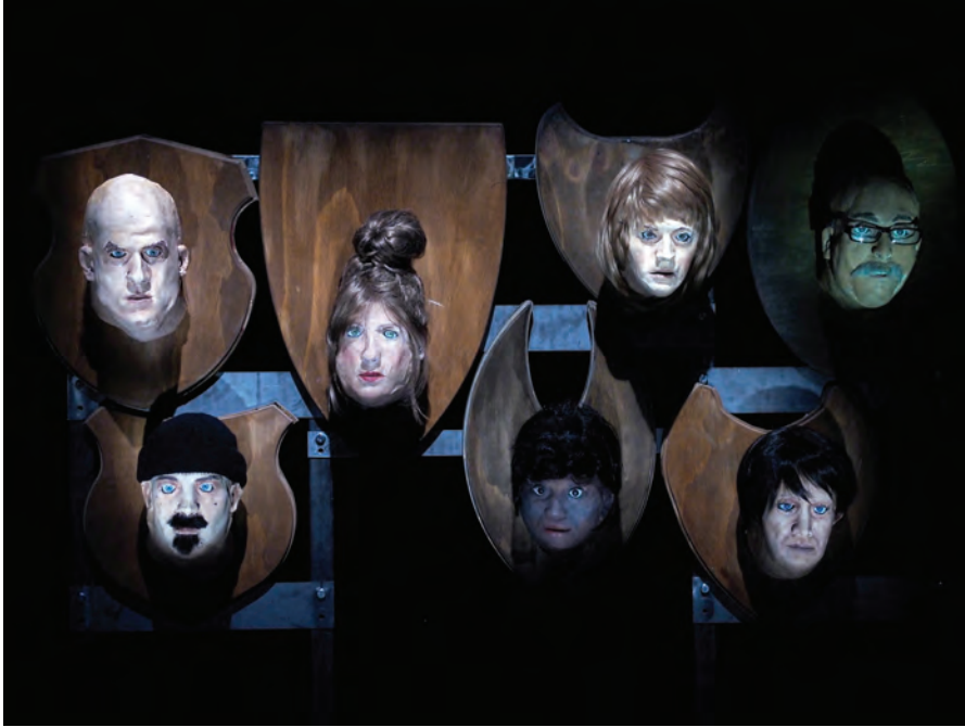
FIGURE 4 – Marta CUSCUNÀ, Sorry, boys , 2016.

texte pour la scène des marionnettes. C'est le cas de la collaboration entre l'auteur américain Dennis Cooper et la metteuse en scène franco-autrichienne Gisèle Vienne, à laquelle s'ajoute le performeur Jonathan Capdevielle 1 , qui participe activement au processus de création. Leur interrelation a été nécessaire à l'adaptation d'une nouvelle de Dennis Cooper, Jerk (2008), par l'utilisation de trois techniques différentes de marionnettes — la manipulation à vue de marionnettes à gaine, le corps-castelet et la ventriloquie. L'histoire de Jerk est inspirée d'un terrible fait divers survenu au Texas dans les années 1970, lorsque le tueur en série Dean Corll, avec l'aide de deux adolescents, David Brooks et son amant Wayne Henley, a tué plus de vingt garçons dans un jeu pervers mêlant toxicomanie, pratiques sexuelles, violence et torture.