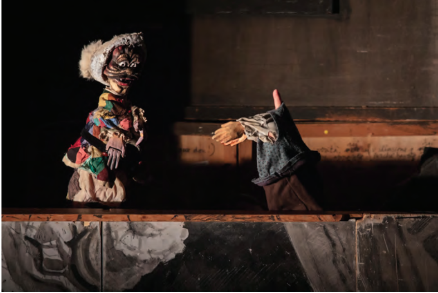
FIGURE 5 – Gigio BRUNELLO, Macbeth all'improvviso , 2001.

plus en plus sinistres qui caractérise l'intrigue de Macbeth , elles sont aspirées dans l'histoire tragique qui ne leur appartient pas. Ainsi, le meurtre du roi Duncan par Macbeth est confondu avec la blessure du marionnettiste par Arlecchino : la marionnette saisit l'épée, la plonge dans l'avant-scène et, alors qu'une main coupée apparaît sur le côté du castelet, le marionnettiste s'exclame : « C'est toi, Arlecchino ! » À la fin de la représentation, le marionnettiste sort avec un bras en moins et une chemise ensanglantée. De même, le meurtre de Macbeth par Macduff est le double de la défaite d'Arlecchino, le révolté, par Pantalone, le vengeur du roi-marionnettiste. Même au moment de la mort d'Arlecchino-Macbeth, le jeu tragique du texte de Shakespeare se fond parfaitement dans la nature même des marionnettes. Le potentiel du médium de la figure est exploité pour créer un dédoublement tragique : grâce à leur identité de marionnettes, conservée comme telle, l'histoire de Macbeth se confond véritablement avec celle d'Arlecchino.