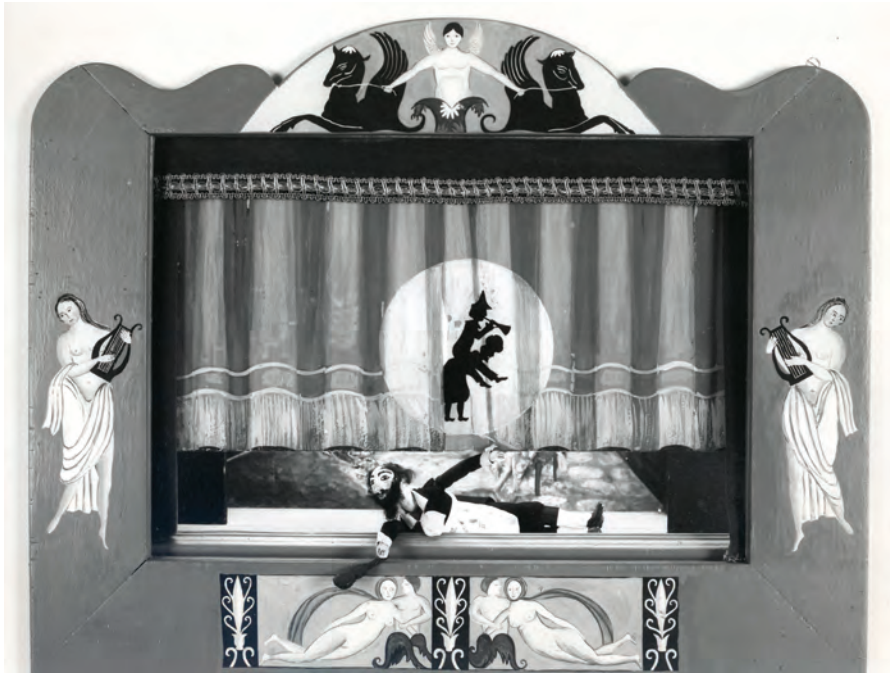
FIGURE 7 – Teatro dei Sensibili, La Iena di San Giorgio , 1986.

de le rendre invisible. La dimension de la marionnette, chez Ceronetti, conduit également à une considération d'un ordre différent. D'un côté, Barnaba Caccù englobe ce sentiment tragique de l'absence de liberté de la nature humaine; en même temps, cependant, la petite marionnette permet d'incarner ces traits odieux, violents, absolus que l'auteur semble, en fin de compte, exalter plutôt que condamner. Barnaba Caccù est un personnage fort, puissant, cruel et dérisoire; il est un « artiste », comme le définit explicitement Ceronetti dans la préface du texte. Il est un « artiste » dans la mesure où il est le créateur de la vie et de la mort : dans un épisode, il tue violemment une femme, non pas pour faire ses saucisses, mais parce qu'elle avait osé l'importuner; plus tard, il aide une femme à accoucher et, le nouveau-né dans les bras, c'est lui-même qui dit « Barnaba Caccù donne la mort. Barnaba Caccù donne la vie.