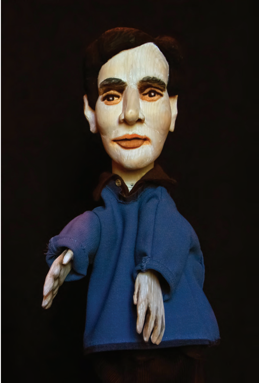
FIGURE 2 – Patrizio DALL'ARGINE, La Sconosciuta della Senna , tête de la marionnette à gaine de Modi, 2017.